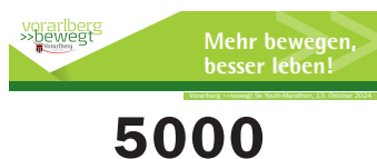
Vorarlberg >>bewegt 5k Youth